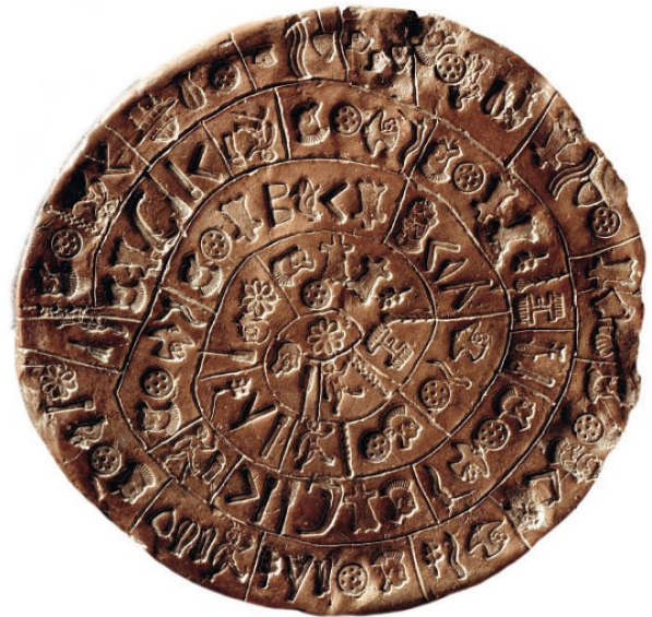
Disque phaistos Crète unicum non déchiffré à ce jour