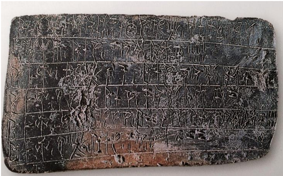
Linéaire B Crète